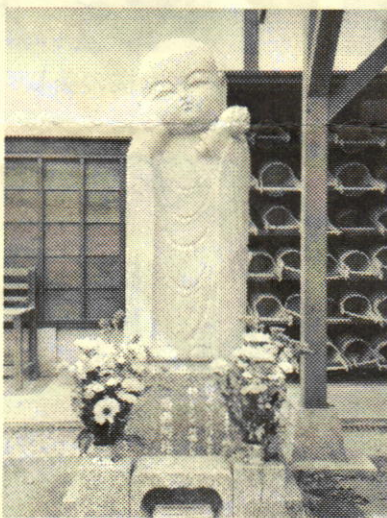
↑ 落成した PPK 地蔵 (ぴんぴんころり地蔵)

ま た、現在増えつつある少子高齢化や、「おひとりさま」に対応した小規模な墓地完成。後継ぎがない「夫婦のみの墓地」にも対応。長く勤め人の経験もした現在の住職は、時代や環境の変化にも柔軟に対応し、地域の人たちの為に日々邁進しております。(記事: 櫛引浩士)