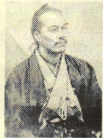
← 山岡鉄舟 肖像

一遍が在世中(1287年)に造られた踊念仏板碑が寺宝としてあります。また、幕末～明治維新の偉人である山岡鉄舟の書いた名号額、院号額が残されてあつて、かつてこの地が上州(群馬)と武州(埼玉)を結ぶ利根川の舟宿場で栄えていたことを偲ぶことができます。